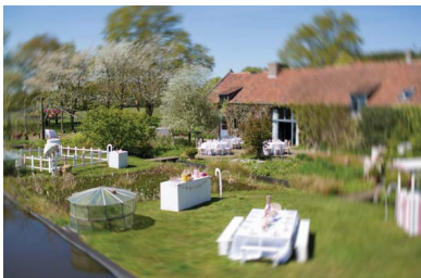
Louises Ponyland, met een terras voor de ouders en een zone waar kinderen baas zijn.

Voor een kind is het leuk om centraal te staan, een feest te krijgen. Maar voor een kind gaat het niet om de grootte van het feest, het is belangrijker zich omringd te voelen. Cadeaus horen er absoluut bij, maar redelijkheid is zinvol. Het posten van foto's van het feest op Facebook komt eerder uit van een behoefte om zichzelf te manifesteren, waardvol te zijn, om waardering te oogsten. De nadruk die je als ouder legt bij een communie heeft een grote invloed. Of het kind betekenis geeft aan een ritueel hangt af van de opvoeders, van de ouders, maar ook van de school. Als opvoeder moet je het kind meenemen in het verhaal."